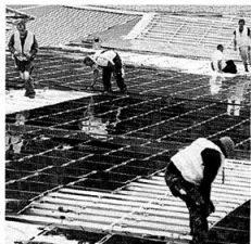
In Duitsland schijnt altijd de zon...

V an de week zei VN-secretaris-generaal Ban Ki-moon dat de tijd van praten voorbij is. Nu handelen. Dat ging niet over Syrië of Oekraïne maar over de opwarming van het klimaat. De opwarming is een feit en daarover hoeven we het verder niet meer te hebben.